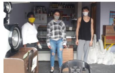
Ação 04 de junho Polo Jardim D'Abril 40 famílias