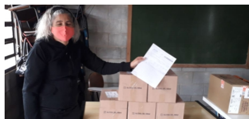
Virgínia entrega o álcool-em-gel