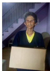
Cestas com produtos agroecológicos Polo Jardim D'Abril - 11 famílias (com idosos e crianças)