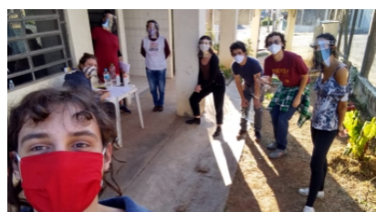
Equipe de voluntários da RAP