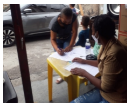
Ação 10 de junho Polo Jardim D'Abril 45 famílias