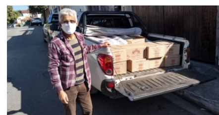
Santana transporta o café e o açúcar