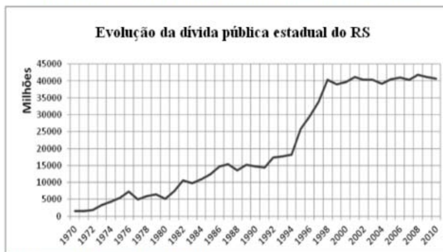
Gráfico 3.1: Evolução da dívida pública estadual do Rio Grande do Sul