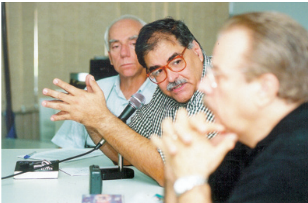
Discussão sobre o conteúdo polarizou as opiniões

Outra coisa que é uma tarefa fundamental para nós todos é constituir a comunicação como objeto de debate público. No Brasil deveria existir a consciência de que a Globo na verdade não é da Globo, ela é uma concessão. Quem é a Globo? É uma empresa que explora uma concessão pública. Não há isso. Então uma tarefa fundamental seria constituir a comunicação como objeto de debate público permanente, até o ponto que nós, um dia, almejássemos ter um debate de formulação de política pública como uma outra área qualquer. Como saúde, como educação, como qualquer outra área. E terceiro, que é uma tarefa dos partidos (e os partidos não avançam na área das políticas, eles temem a influência da mídia no mundo contemporâneo, você não faz política sem mídia), há coisas que podem ser ações bem concretas, por exemplo, os conselhos de comunicação social, embora sejam órgãos auxiliares, eles deveriam também ser instalados no