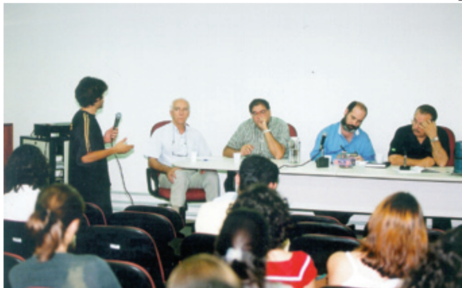
Estudante intervém no debate

O valor das ações de telecomunicações era de 3,4 trilhões de dólares no início do ano 2000. Hoje é de 1,3 trilhão de dólares. Ou seja, é um terço! Isso evaporou, e significou a demissão de 1 milhão de profissionais. É uma crise global. É preciso que, se um país tem as dimensões que o Brasil tem, ele se defenda do lado absolutamente selvagem da globalização. Nós temos que tentar