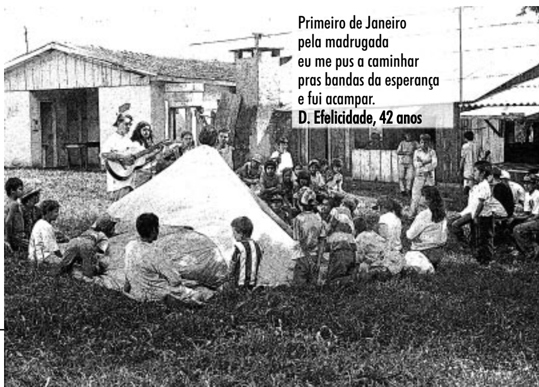
Primeiro de Janeiro pela madrugada eu me pus a caminhar pras bandas da esperança e fui acampar. D. Efelicidade, 42 anos

Assim como o acampamento Oziel desejou a oficina de Poesia Viva , relegou-a à andança. A ofici-