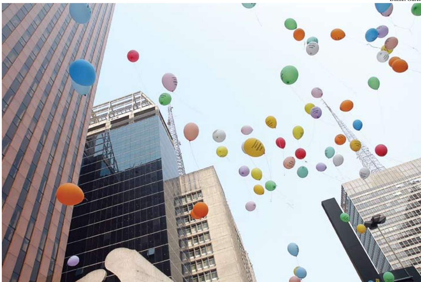
Nos balões, a inscrição "Concessões de Rádio e TV: quem manda é você". São Paulo, 5/10/07