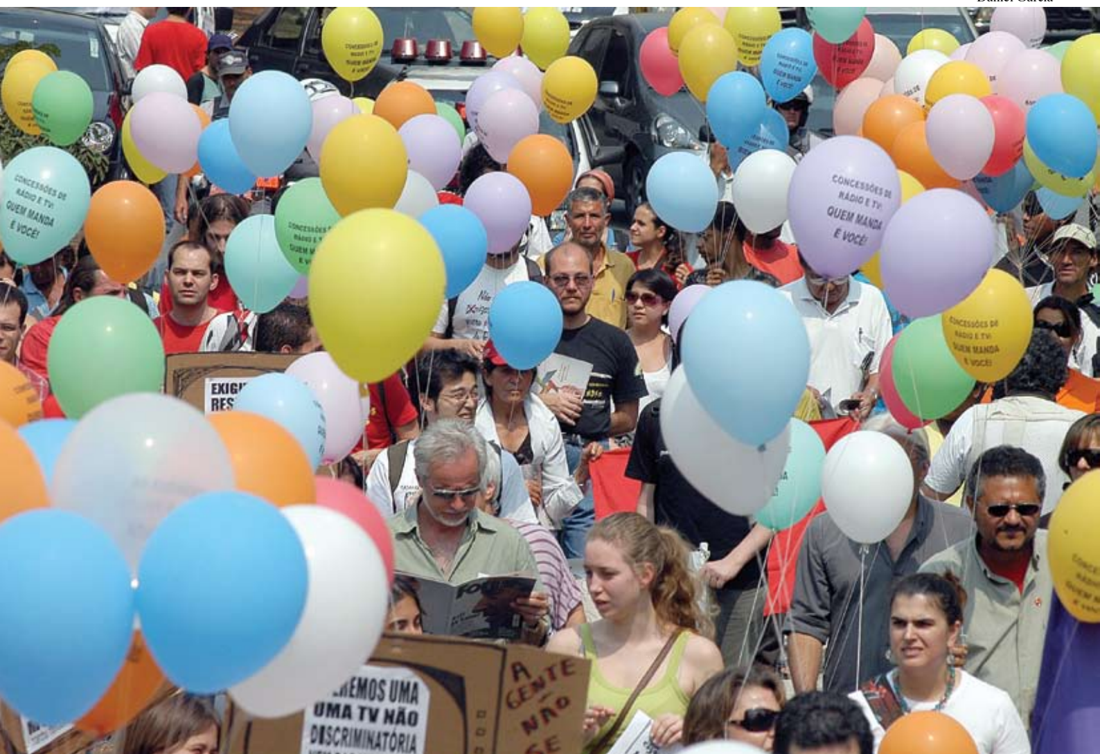
Manifestação por mais transparência nas concessões (São Paulo, 5/10/07)